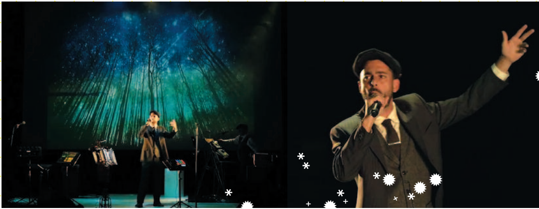
Pénélope , conte hip-hop et vidéo