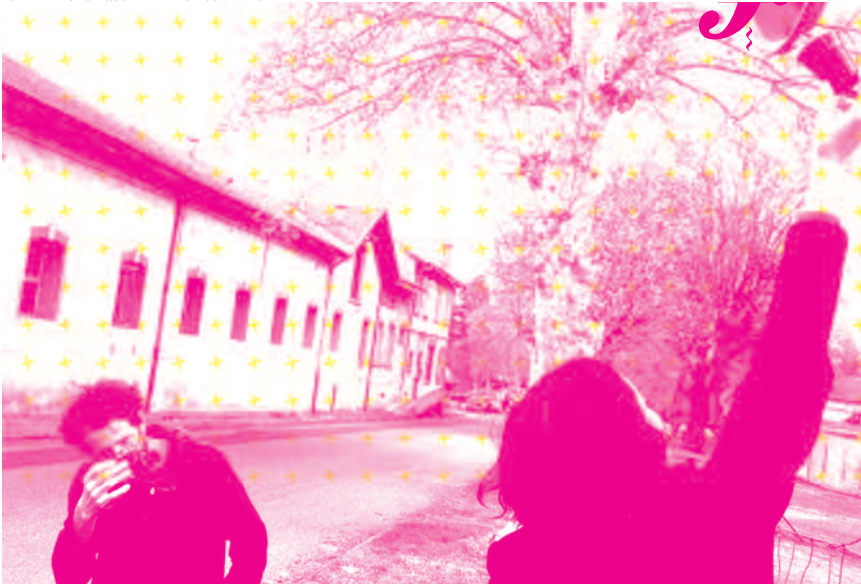
Projet 60 centimes