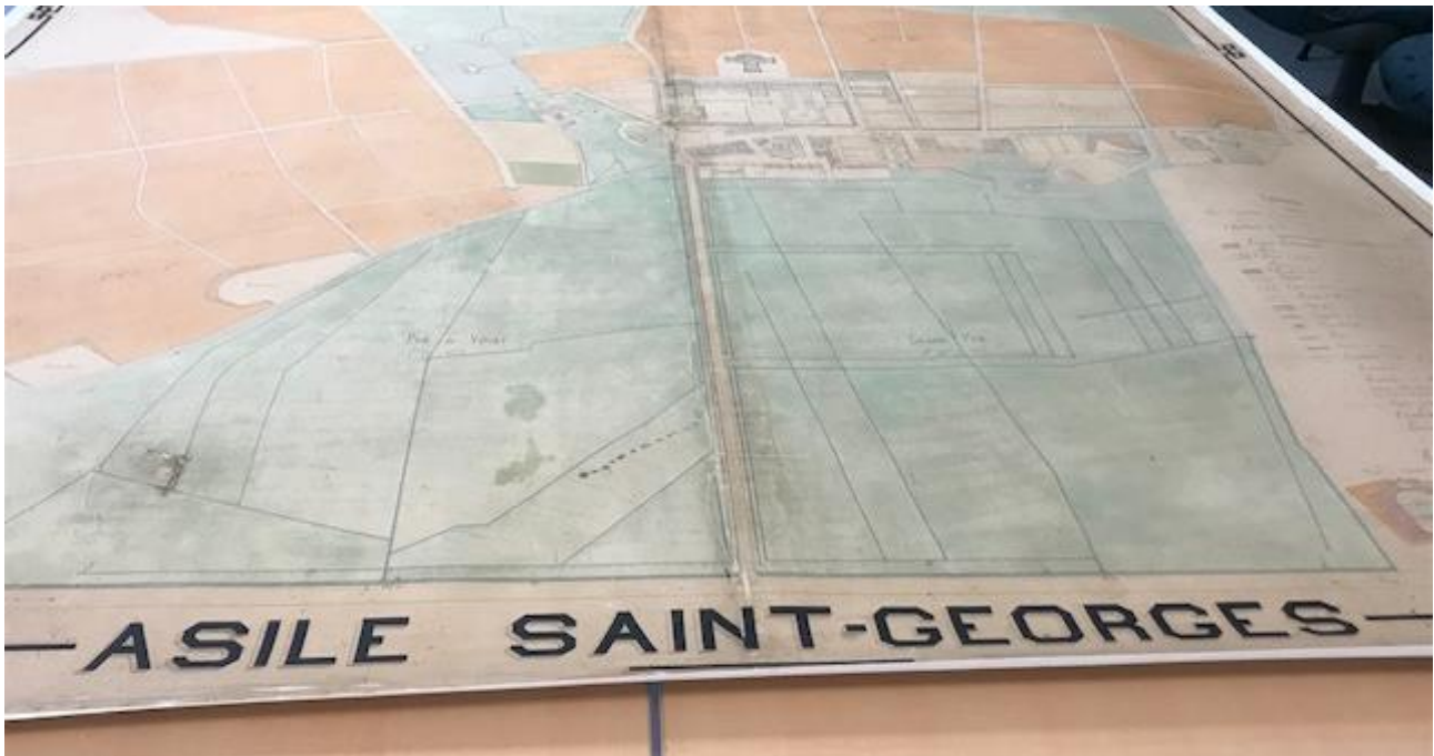
© Archives Départementales de l'Ain - H-dépôt CPA 1443

À l'automne 2019, associés à de nombreux partenaires, le dispositif Culture NoMad et le service central des archives lancent une exposition d'envergure sur l'histoire du Centre Psychothérapique de l'Ain, de la création des asiles départementaux au XIX e siècle jusqu'à demain. Cette exposition, retraçant une histoire de la psychiatrie dans l'Ain, est une première dans l'Ain.