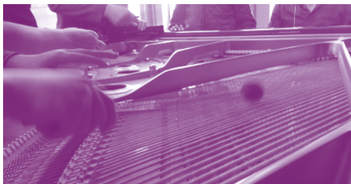
Table ronde sur la création musicale dans les établissements de santé

Le mardi 26 avril 2019, 18h30 - 20h30, au Périscope, Lyon 2