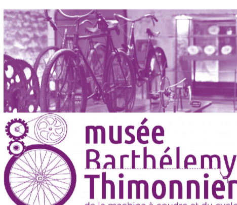
musée Barthélémy Thimonnier de la machine à coudre et du cycle

Géré par la Communauté d'agglomérations de l'Ouest Rhodanien (COR) et situé à Amplepuis, le Musée Barthélémy Thimonnier de la machine à coudre et du cycle présente des collections d'objets retraçant l'évolution de ces deux inventions du 19 e siècle. Il organise notamment des ateliers hors les murs de manipulation d'objets anciens du quotidien, permettant des moments de partage autour des gestes d'autrefois.